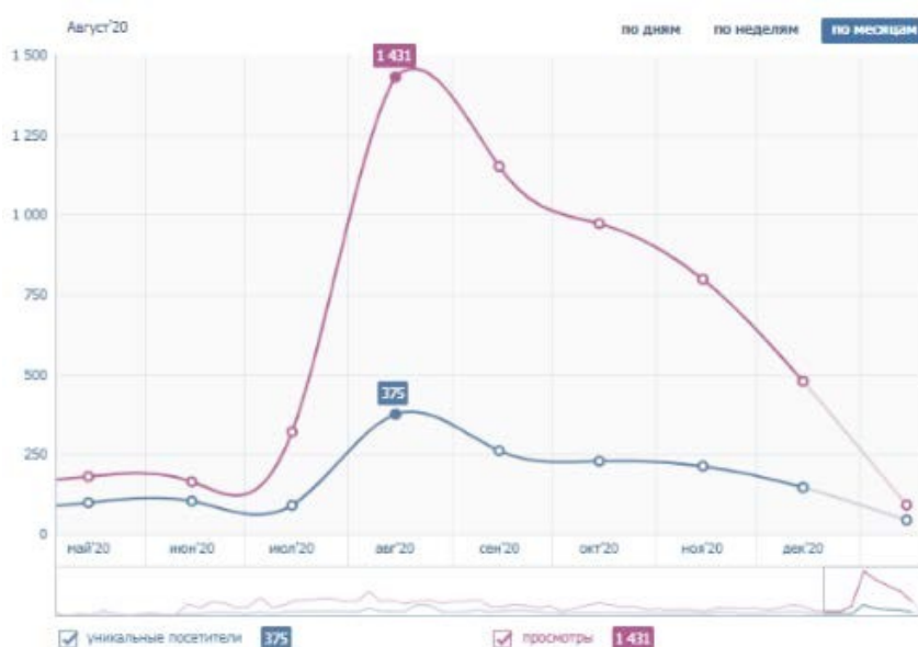
Рисунок 3. Уникальные посетители и просмотры официальной группы в социальной сети

География пользователей – Россия (99,15%), Екатеринбург (89,22%). Вкрапление иных стран (Германия, Беларусь, Турция) и городов (Москва, Санкт-Петербург, Каменск-Уральский, Касли) говорит о информационном интересе к представляемому материалу и его актуальности.