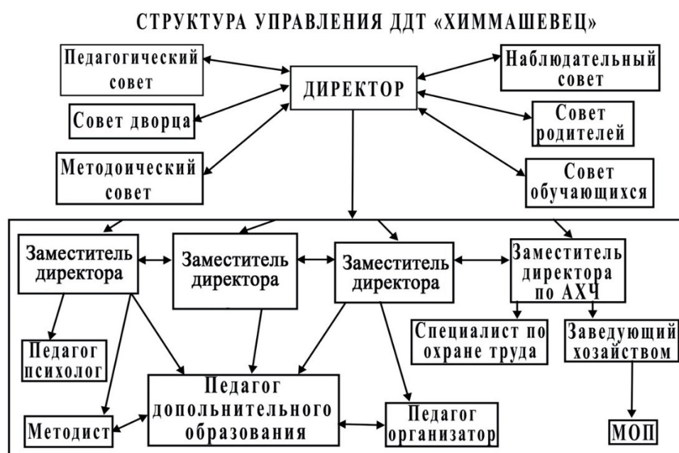
Рисунок 1. Структура управления ДДТ «Химмашевец»

Управление Дворцом осуществляется в соответствии с Федеральным законом «Об образовании в Российской Федерации» и настоящим Уставом на принципах демократичности, открытости, коллегиальности, приоритета общечеловеческих ценностей, охраны жизни и здоровья человека, свободного развития личности, единоначалия и самоуправления. Структура управления образовательной организацией представлены на рисунке 1.