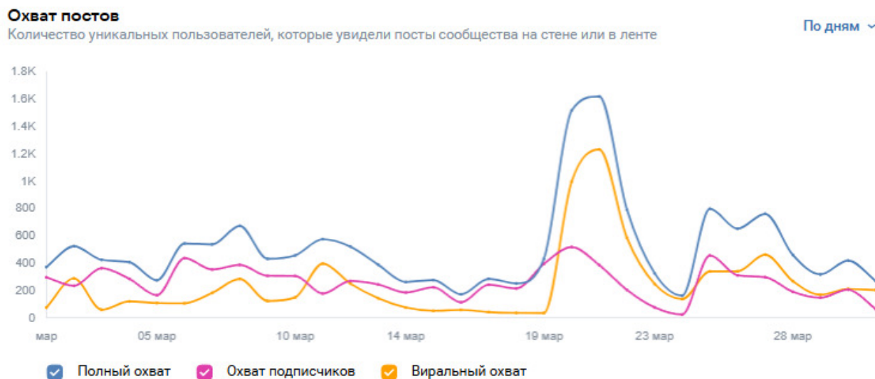
Рисунок 3. Общая статистика сообщества по дням.

Типы устройства для просмотра информационного сайта – смартфоны (95,3%), персональный компьютер (4,6%).